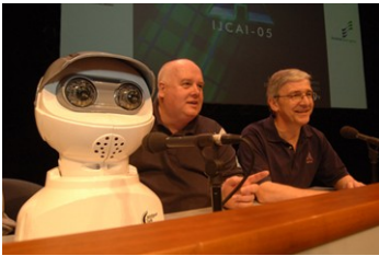
Imágenes de la edición 2005 de IJCAI en Gran Bretaña.

La International Joint Conference in Artificial Intelligence (IJCAI) es una de más importantes conferencias internacionales de investigación en Inteligencia Artificial . Se celebra desde 1969 y se ha realizado en distintos países como Japón, EE.UU., Alemania, China e India. Cubre todo el espectro del área y asisten a ella los más importantes referentes del tema.