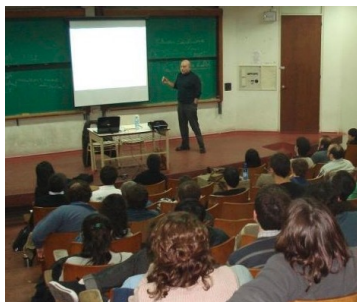
Imágenes del curso del Prof. Gregorio Chaitin.

ESTE AÑO LA ESCUELA CUMPLIÓ SU 25° ANIVERSARIO Y LO FESTEJÓ CON TODA LA COMUNIDAD