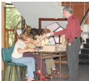
Los graduados representan al 25% del máximo órgano de gobierno de la Facultad.